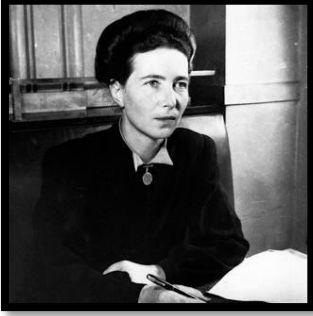
سيمون دي بوفوار