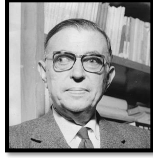
جان بول سارتر